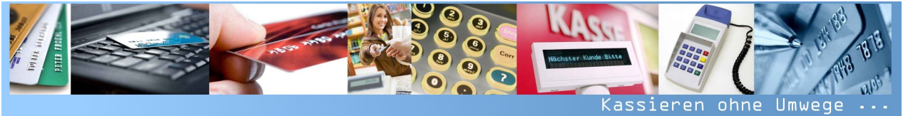
Kassieren ohne Umwege ...